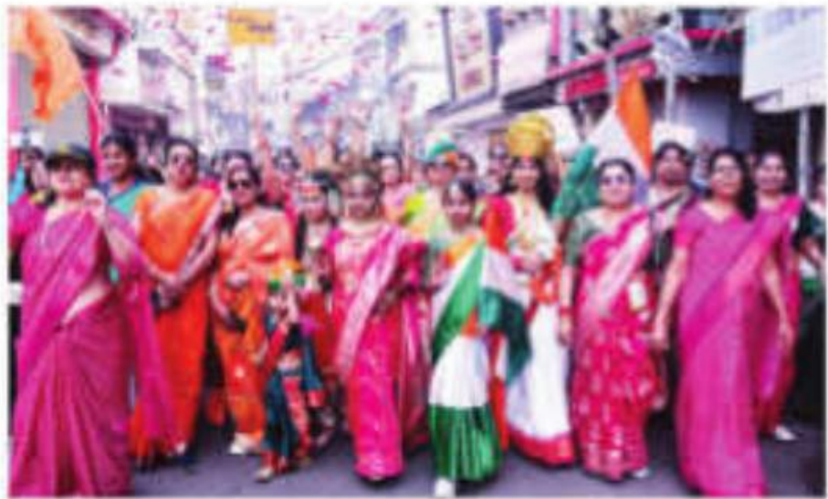
Women participate in the 'Saree Walkathon' on the occasion of National Cancer Awareness Day in Jabalpur on Thursday.

Women participate in the 'Saree Walkathon' on the occasion of National Cancer Awareness Day in Jabalpur on Thursday- The Statesman, 8 th Nov. 2024