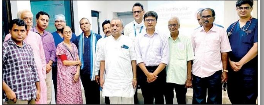
নারায়ণ সুপারস্পেশ্যালিটি হাসপাতালে রোগীদের সঙ্গে চিকিৎসকেরা।